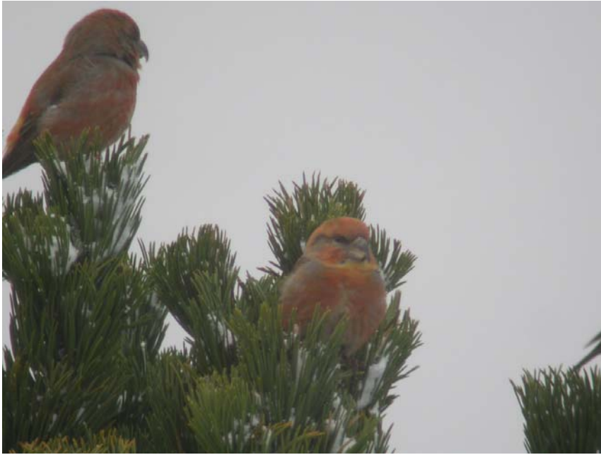
Figur 7 Furukorsnebb, desember 2003