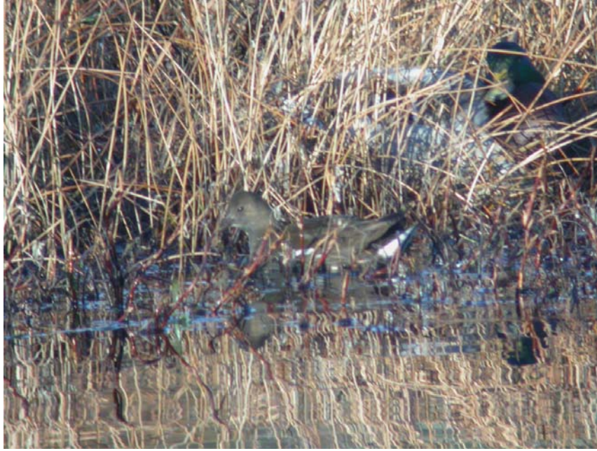
Figur 4 Sivhøne ved Husvatnet

Et individ, antatt til å være det samme observert minst 8 ganger mellom 18 oktober og medio desember. Veldig sky og gjemte seg godt i regn og blåsevær.