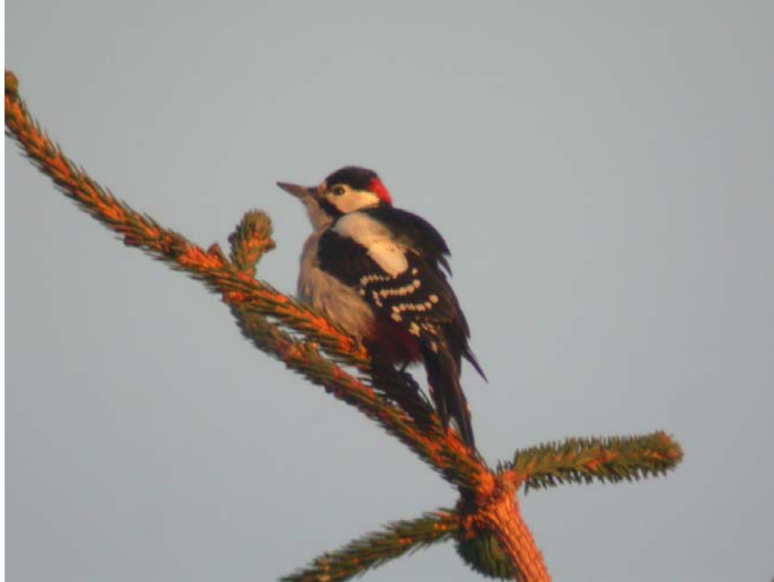
Figur 6 Flaggspett, høsten 2003

Første fuglen dukket opp ultimo august og deretter var arten loggført de alle fleste observasjonsdagene mot slutten av året. En klar topp i siste halvdel av oktober da 4 fugler var notert flere ganger. Gradvis avtok mot slutten av året, men 1-2 fortsatt på plass ved årsskifte.