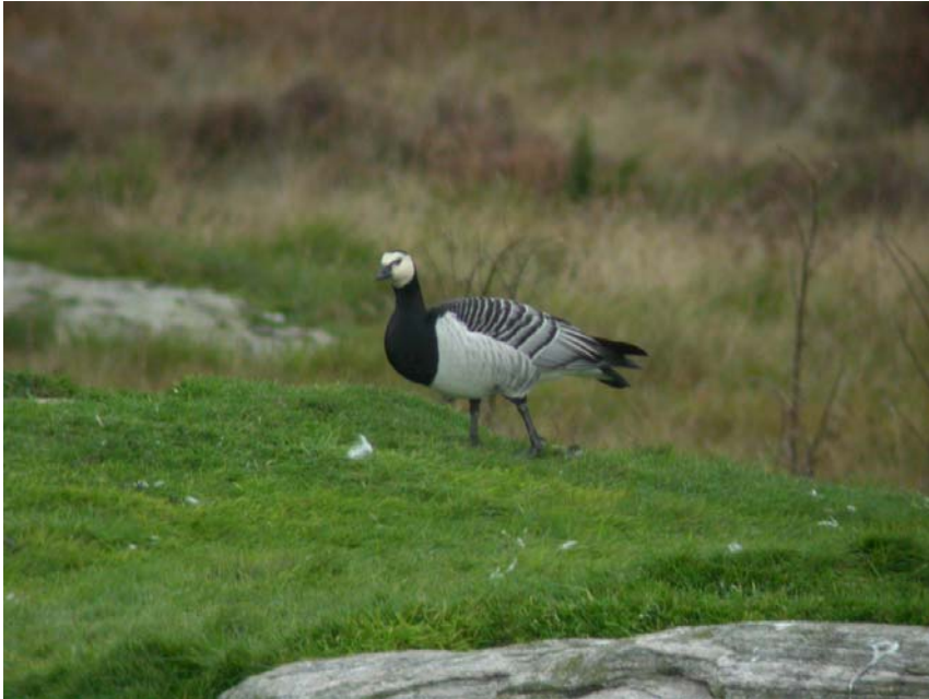
Figur 2 En av to hvitkinngjess ved Husvatnet