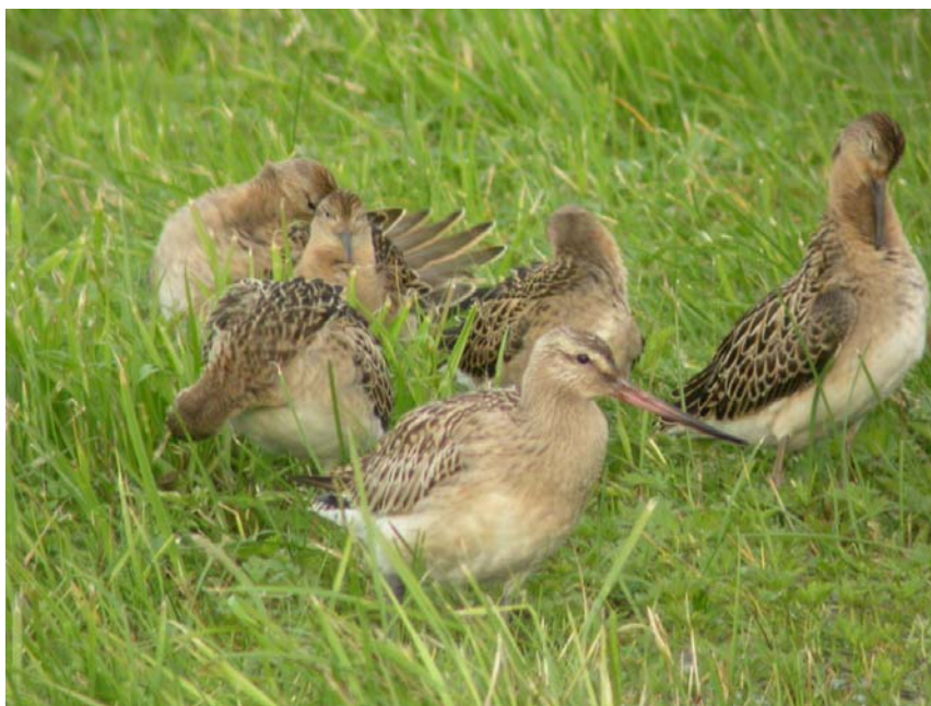
Figur 5 Lappspove sammen med brushøns, 11. september 2003

En 9. mars var eneste vår observasjon og en sammen med brushøns 11-12 september var den eneste høst registrering.